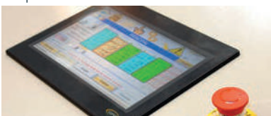
Cargador TRANSFER PLUS con pantalla táctil